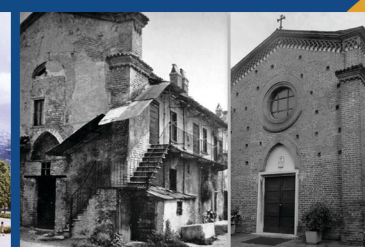
Via Dossoni - Cimiano - Milano